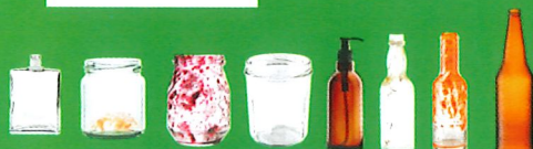
Bouteilles, pots et bocaux en verre

BIEN VIDER, SANS RINCER, SANS BOUCHON NI CAPSULE