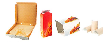
Emballages en carton fin