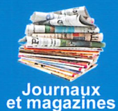
Journaux et magazines