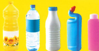
Bouteilles, flacons et bidons en plastique