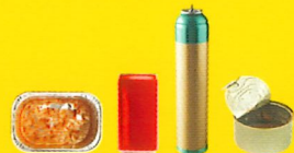
Emballages en métal